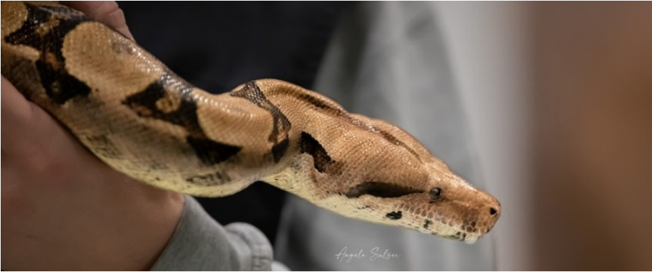
Hier im Bild eine ausgewachsene Boa.

Zur Verhinderung von Tierleid ist es notwendig, die Haltung langlebiger Exoten unter Bewilligungspflicht zu stellen. Die Tatsache, dass die Tierschutz-Gesetzgebung Auflagen zur Anschaffung/Haltung solcher Arten vorgibt, dürfte Kaufinteressenten daran hindern, unüberlegt Jungtiere zu kaufen, die dann 30-60 Jahre bei ihnen bleiben möchten. Zudem müsste der Verkauf an Tierbörsen, an denen junge Exoten angeboten und vor Ort an jedermann verkauft werden, per sofort verboten werden. Grundsätzlich besteht zwar für die Verkäufer eine Informationspflicht an die Käufer, diese wird allerdings nach Berichten des Schweizer Tierschutz STS nicht wie gewünscht umgesetzt. Sowohl die Bewilligungspflicht wie auch ein allfälliges Verbot vom Verkauf an Tierbörsen sind politische Aufgaben, die gesamtschweizerisch zu lösen sind. Ein Erfolg solcher Massnahmen stellt sich nicht sofort ein, die langlebigen Tiere sind ja platziert und der «Abgabe-Bedarf» steigt voraussichtlich in den nächsten Jahren eher an, als dass er abnimmt. Es braucht Jahrzehnte, um das Problem zu lösen.